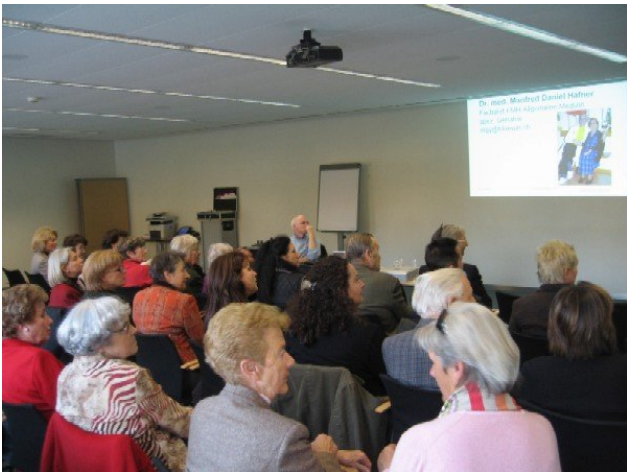
Ein stattliches Publikum wartet auf die Informationen ...