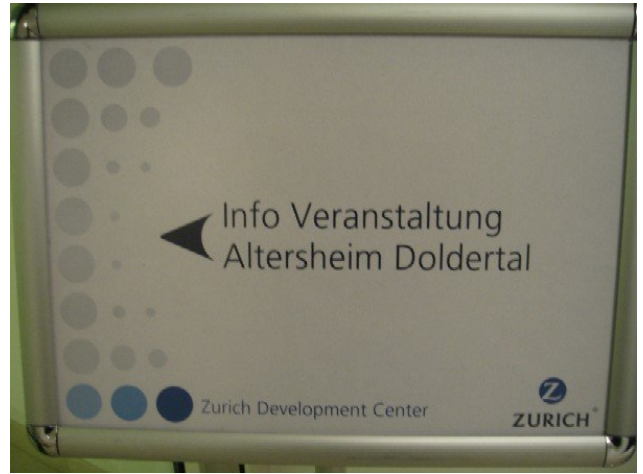
Wir werden professionell empfangen