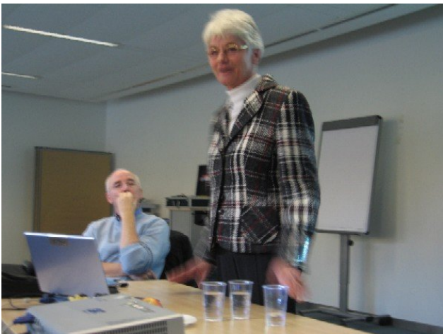
Einführungsworte der Präsidentin des Vereins