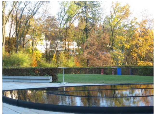
im prächtigen Areal der früheren Bircher Benner Klinik