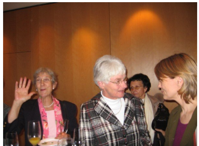
Zum Abschluss plaudert man gemütlich bei Apéro