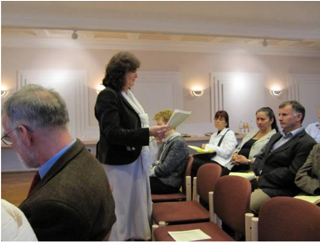
Revisionsbericht E. Reinhardt an der vorgängigen GV