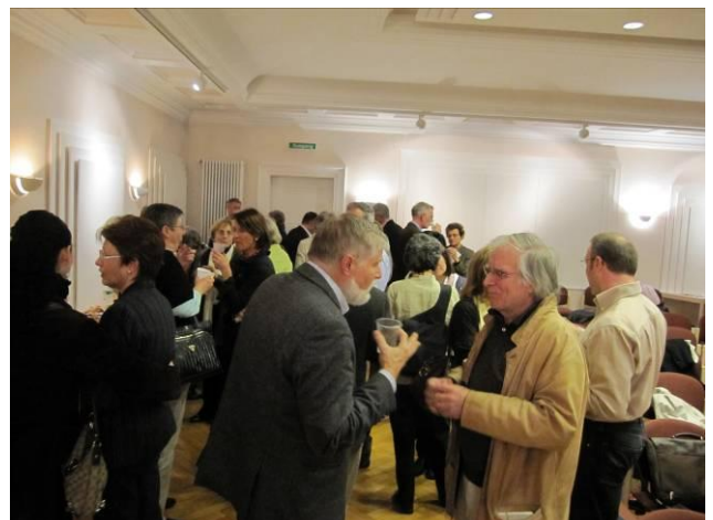
Intensive Gespräche mit reichlich servierten Häppchen