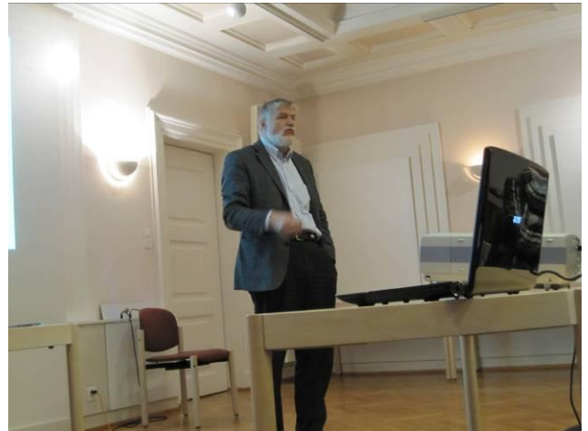
Der Stadtarzt mit gewohnt einleuchtenden Aussagen