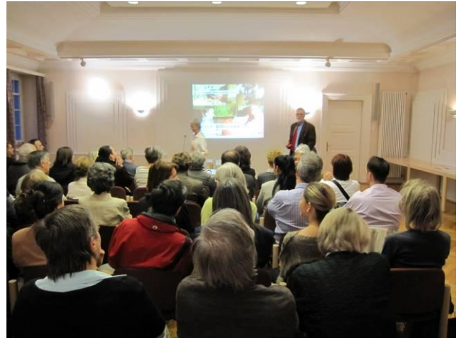
Im Gemeindesaal des genau 90-jährigen Moser-Baus