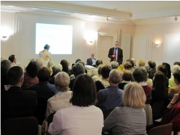
HR Winkelmann führt im vollen Saal den Referenten ein